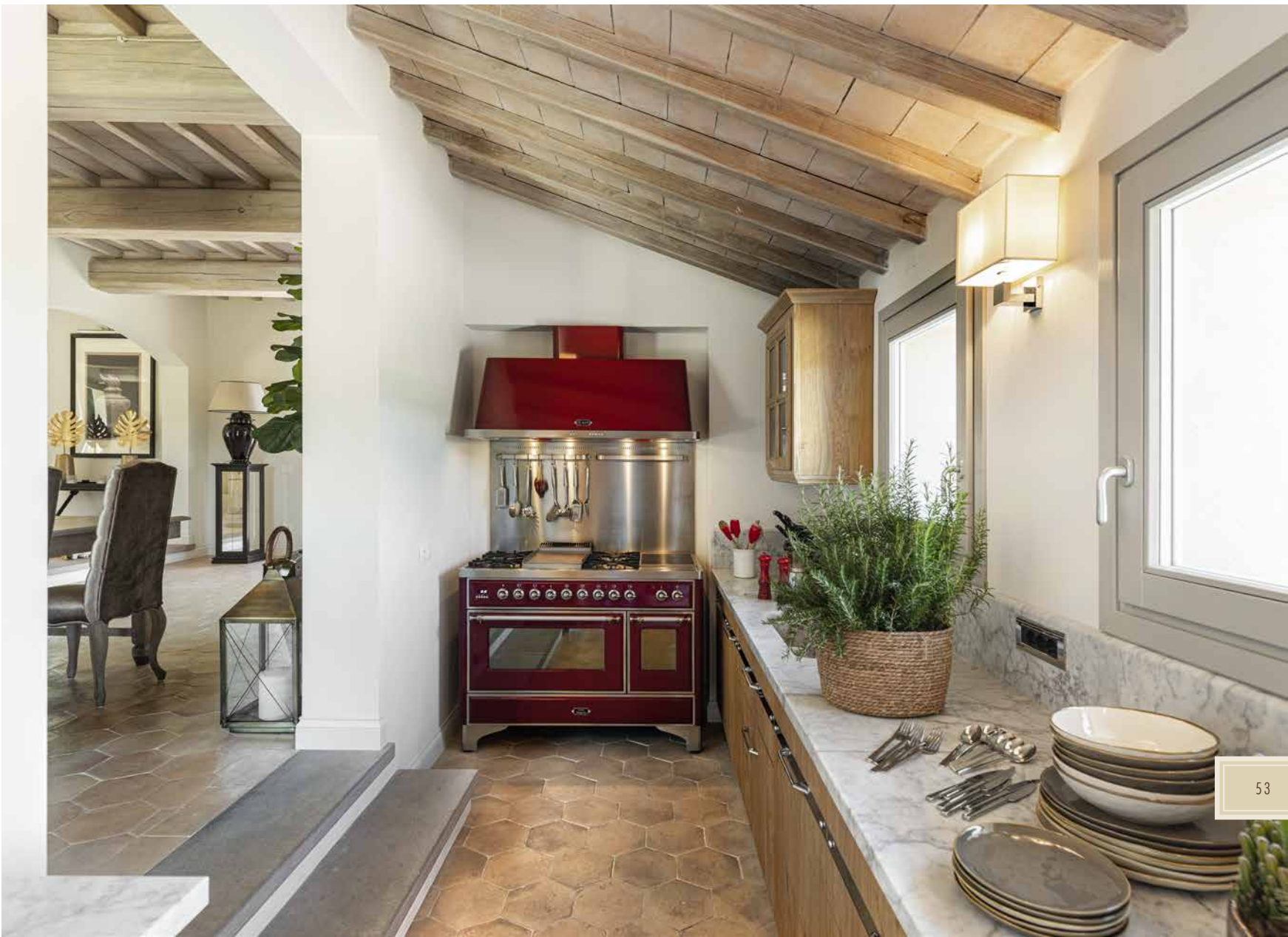
PICCOLA MA FUNZIONALE È LA CUCINA IN MURATURA, PROSEGUIMENTO DELL'AMBIENTE DEDICATO AL PRANZO.