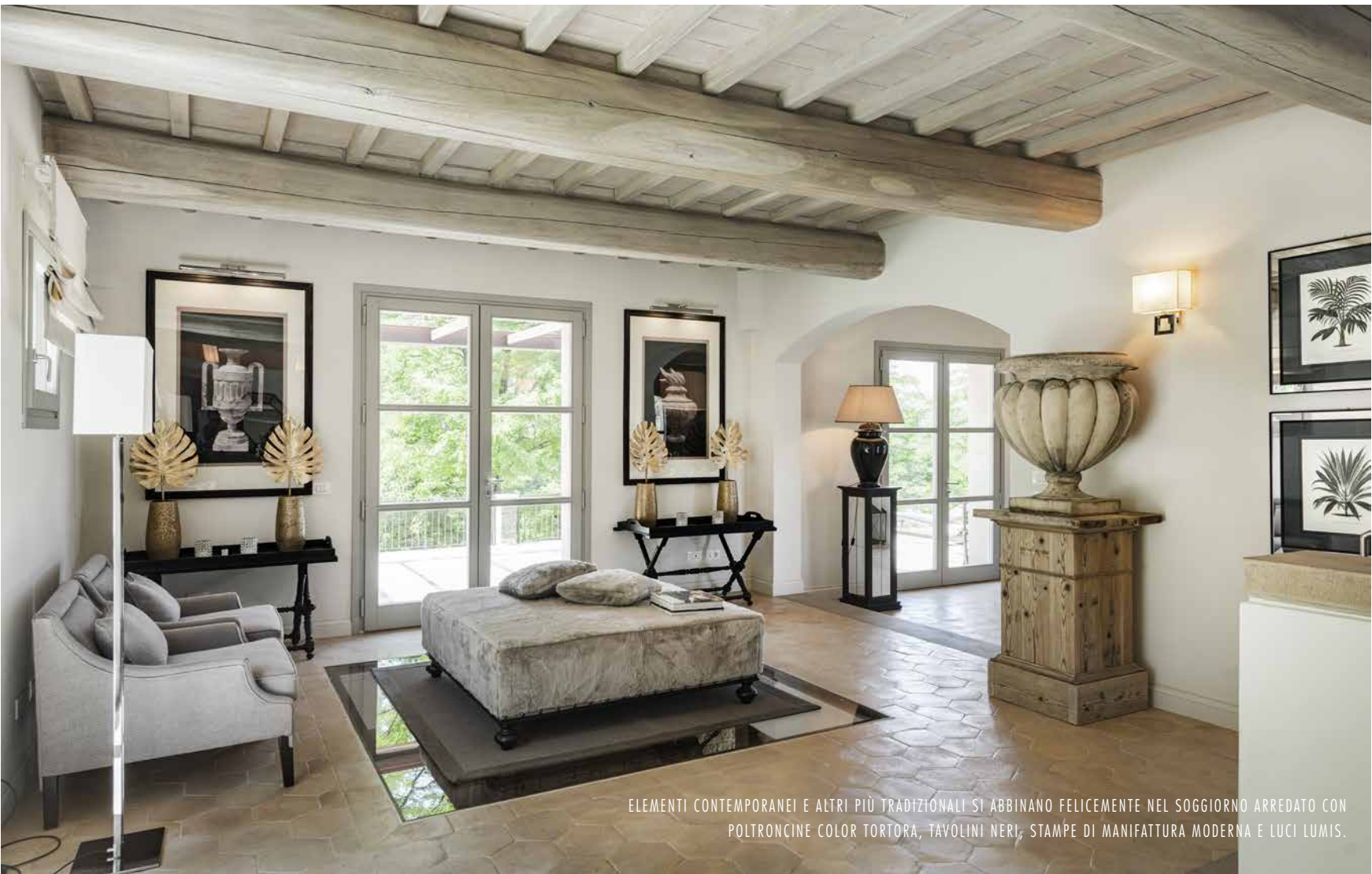
ELEMENTI CONTEMPORANEI E ALTRI PIÙ TRADIZIONALI SI ABBINANO FELICEMENTE NEL SOGGIORNO ARREDATO CON POLTRONCINE COLOR TORTORA, TAVOLINI NERI, STAMPE DI MANIFATTURA MODERNA E LUCI LUMIS.

S i parte dal piano terra, quello in cui si sviluppa l'ampia zona giorno (di circa 100 metri quadri) che comprende, in un unicum impeccabile, cucina, living e sala da pranzo. In quest'ultimo ambiente spiccano un tavolo di fine Ottocento, di origine toscana, e stampe di manifattura contemporanea, che rispecchiano quindi lo stile adottato in questi ambienti domestici permeati, peraltro, da un sofisticato gusto franco-belga evidenziato da sedute color tortora e da tavolini neri. In un angolo del living si trovano poi un camino in travertino, per allietare le serate invernali, sopra il quale si erge un rotondo specchio di fattura contemporanea. Anche nella zona notte, situata al piano superiore e composta da tre camere da letto e due bagni, troviamo dettagli e finiture molto curati. Come i letti ideati dallo stesso Lionetti e realizzati dalla Tappezzeria Lari. Il sapiente studio degli arredi e delle tonalità, in grado di integrare perfettamente lo stile contemporaneo al tipico gusto toscano, e l'attenzione verso i materiali utilizzati sono riusciti ad imprimere in questa abitazione un gusto sofisticato e un grande respiro internazionale.