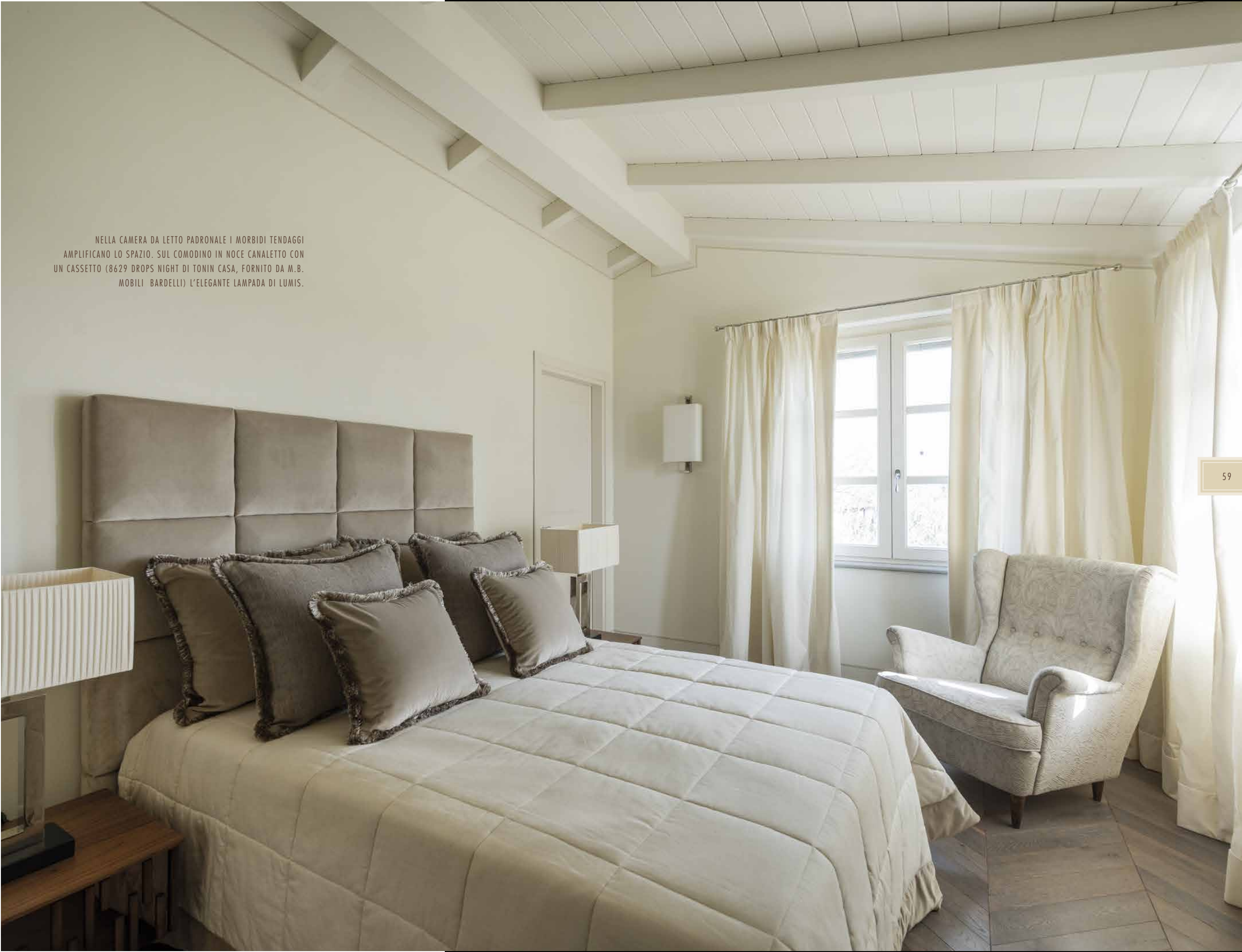
NELLA CAMERA DA LETTO PADRONALE I MORBIDI TENDAGGI AMPLIFICANO LO SPAZIO. SUL COMODINO IN NOCE CANALETTO CON UN CASSETTO (8629 DROPS NIGHT DI TONIN CASA, FORNITO DA M.B. MOBILI BARDELLI) L'ELEGANTE LAMPADA DI LUMIS.

La camera padronale gioca sempre su nuance molto naturali: qui il movimento di impalpabili tessuti amplifica la luminosità, in sintonia con il soffitto di travi a vista sbiancate. Il bagno è un trionfo di travertino, ove ben si accorda lo stile Old England della rubinetteria cromata. Ed ecco che la sostanza diventa impronta dell'amore per la terra e il progetto è il medium per amplificarne le potenzialità. E si pensa a Moore, e al suo concetto demiurgico di materia plasmata: le sue donne dalle lunghe membra, primitive, deformate, bellissime, giacevano placide in un abbraccio di terra e materia. Marmi antropoidi e legni umanoidi erano l'immanente dichiarazione di materia viva, seppur statica. L'arte per lui non era un placebo per gli affanni, né un'epifania di buon gusto. L'arte era esercizio paziente di vita, così come egli stesso dava forma alle sue creature, con scalpelli e bocciarde: lento, accorto, amorevole.