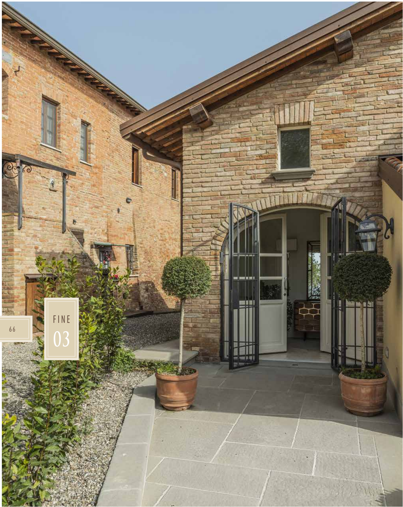
VISIONE D'INSIEME DELLA DIMORA, DOVE SPICCA L'INGRESSO. LA PAVIMENTAZIONE E I CORDONATI SONO REALIZZATI IN PIETRA ARENARIA SCALPELLATA, OPERA DI SPOGLIANTI S&M.