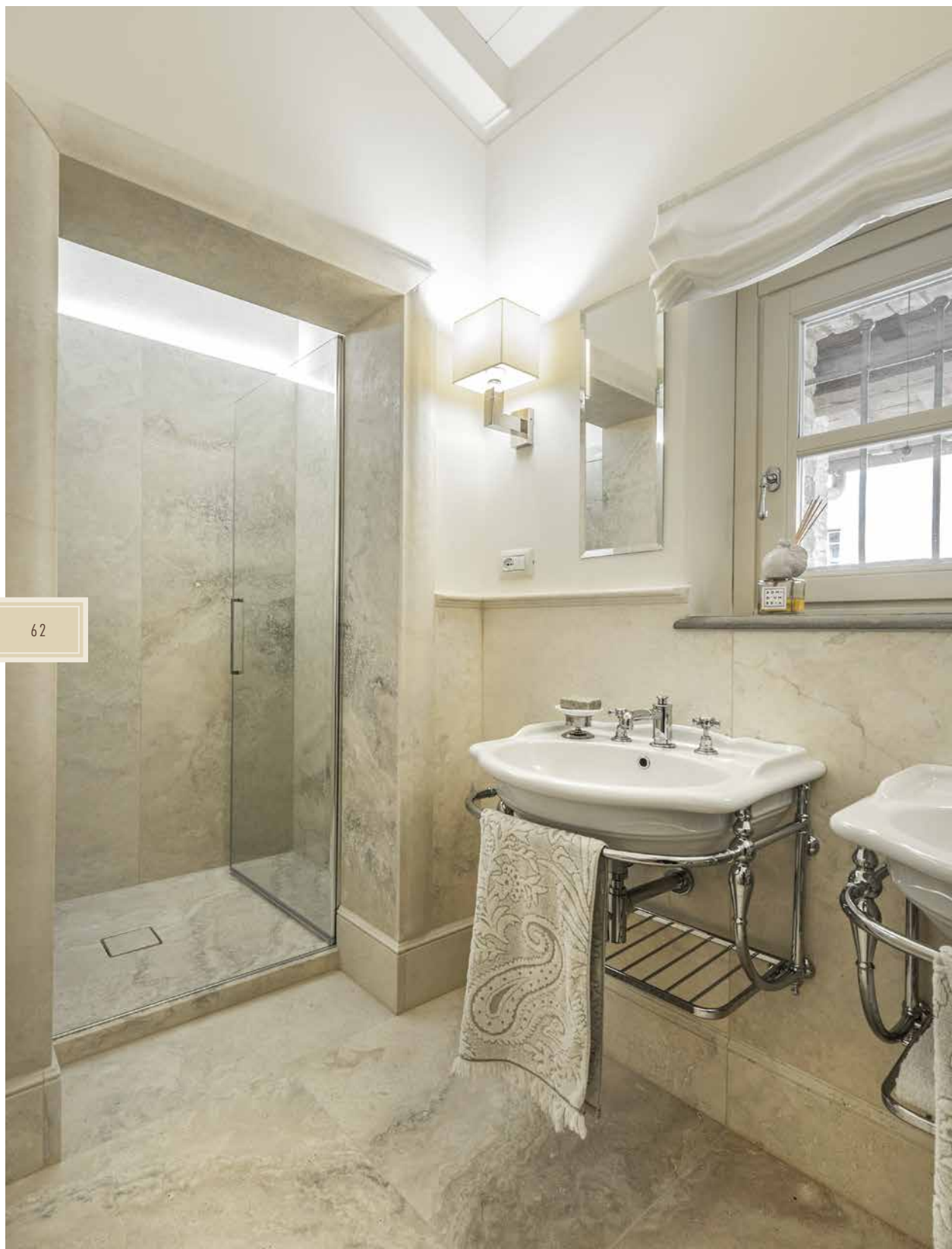
IL BAGNO È UN TRIONFO DI TRAVERTINO (VANNI). I SANITARI IN PROCELLANA BIANCA ESIBISCONO ELEGANTI RUBINETTERIE CROMATE IN STILE OLD ENGLAND (CITIS).